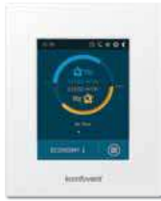
пульт управления C5.1